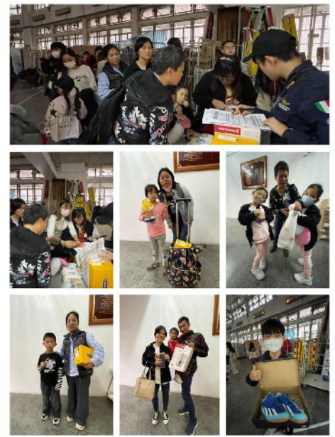
愛心天使達成許願天使的聖誕禮物願望