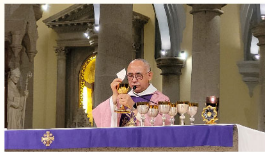
喜樂主日提前彌撒

今年還有一個新環節，就是邀請了30多位「代禱軍」，分別在24小時內無間斷地用誦念玫瑰經的方式陪伴耶穌聖體，更特別為世界和平及罪人悔改的意向祈禱。期望我們的禱聲能直穿雲霄，上達天主台前，蒙主悅納，亦渴望有更多的人願意做賠補——守齋、克己和犧牲。