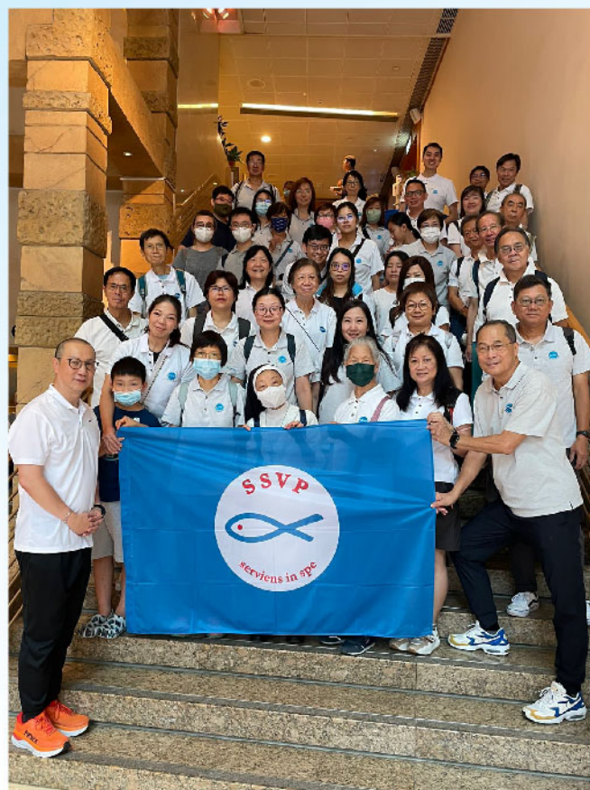
聖雲先協會部份參與者

我們這一隊負責中西區，先前往堅道關心無家者伯伯，他們常常被人忽略，沒有安全地方保管財物，我們可以多點關注這些無家者。接著，我們到結志街垃圾站探望清潔工，感謝他們每天的辛勞和努力，才讓區內環境保持整潔，看到他們臉上的笑容，我們內心也充滿平安喜樂。我們到百子里公園，我們遇到一位坐在那裡的清潔工，他是一位南亞裔人士，看到他有些疲憊，我們遞上禮物包和現金券，我們亦不打擾他休息啊。有時候身體語言和行動，勝過千言萬語。在路上，我們遇到另一位正在清理垃圾的清潔工，當他知道我們關心他時，他露出笑容並多次表示感謝。同樣於荷李活道公園的涼亭內，我們亦遇到兩位公園的無家者。他們低頭不多與人交流，但我們真誠的關懷能看到他們臉上的笑容，我們內心被溫暖了，