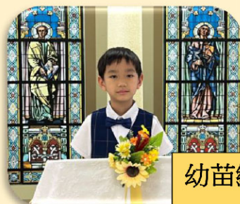
幼苗組 (6 - 8 歲)