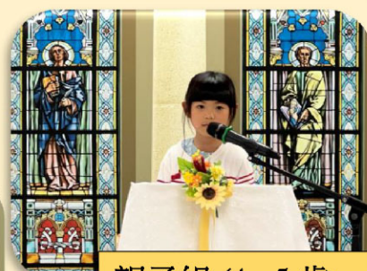
親子組 (4 - 5 歲)