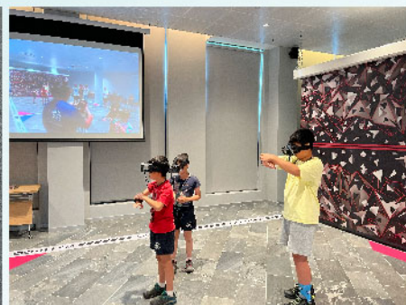
HADO AR 虛擬閃避球