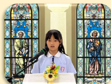
青苗組 (9-12 歲)