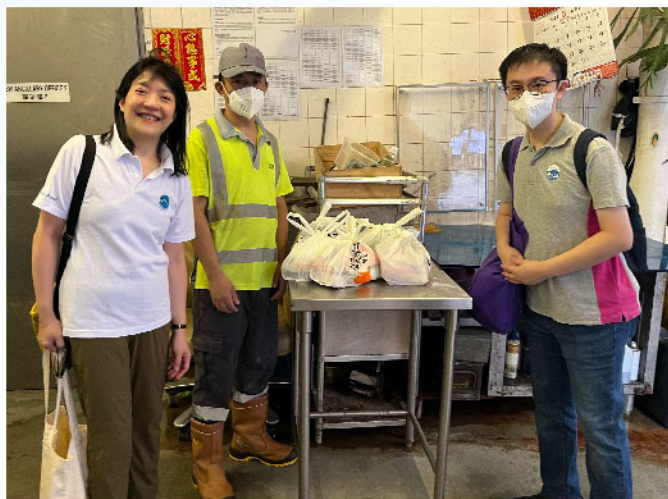
結志街探訪垃圾站清潔工

這次愛心送暖關懷行動展現了聖雲先會及其他參與協會對於社區弱勢社群的關懷和支持。透過實際行動，我們帶給無家者、清潔工、公園老人和紙皮婆婆伯伯們溫暖和關懷。這樣的行動也豐富了參與者的心靈，彰顯了人們之間的連結和共融。