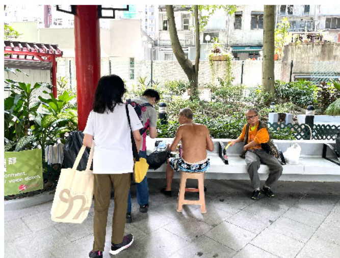
荷李活道公園的無家者