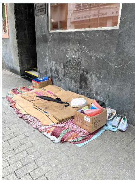
中區堅道的無家者

因為我們知道天主就在此時此刻與我們同在。紙皮婆婆通常在晚上會在街上處理紙皮，所以我們晚上嘗試去找她，當我們見到紙皮婆婆時，她正在整理紙皮和準備推車下斜坡，我們迅速上前幫忙，同時表達我們的關懷及送上禮物包，她非常高興地與我們交談。