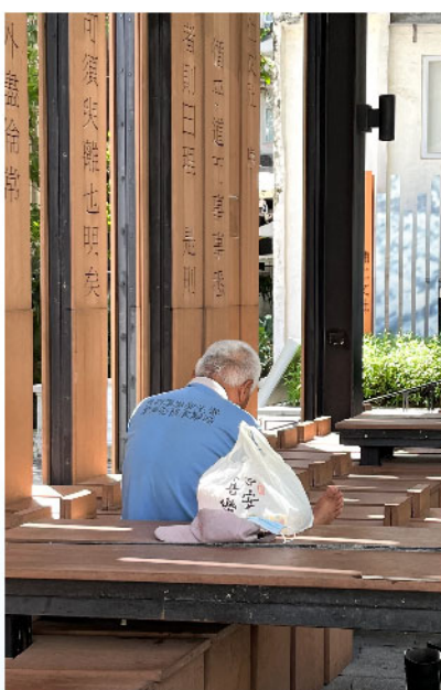
百子里公園的南亞裔清潔工