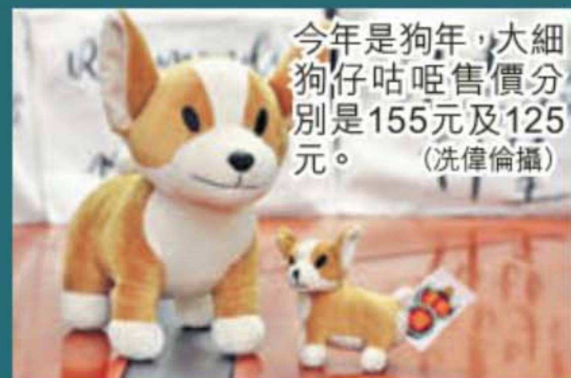
今年是狗年，大細狗仔咕啞售價分別是155元及125元。

為期7日的年宵，需要大量人力「看檔」，委員會在校內招募了30多位義工。負責財務及宣傳的Calvin指，委員會花了2周面試，考驗義工是否具口才、膽識及應變能力等，從70人中揀選了30多位精英。